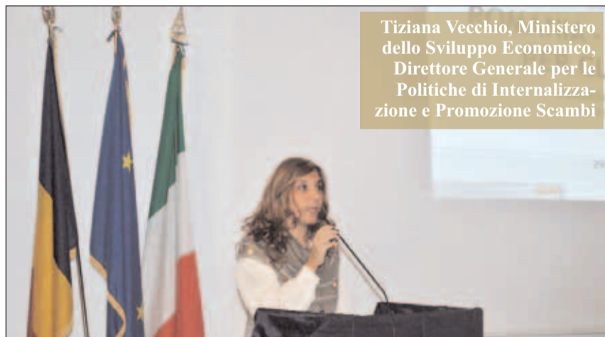
Tiziana Vecchio, Ministero dello Sviluppo Economico, Direttore Generale per le Politiche di Internalizzazione e Promozione Scambi

Si è svolto il 29 novembre 2013, presso l'Accademia di Romania a Roma, il quarto appuntamento del Forum Economico Italia-Romania