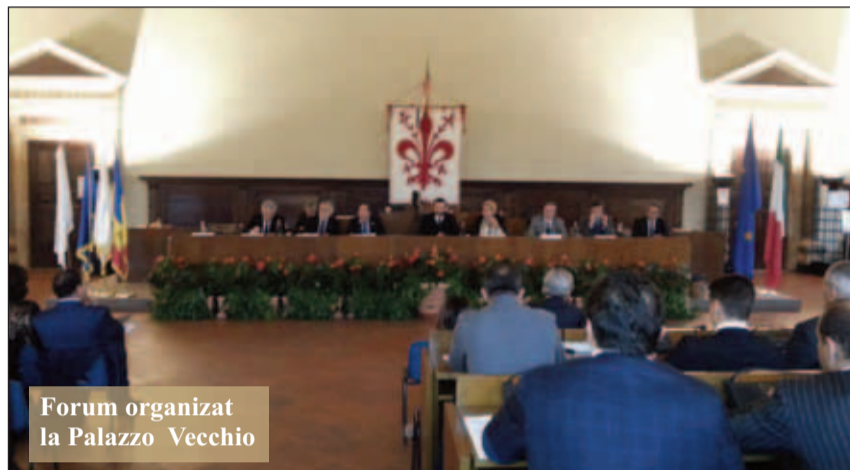
Forum organizat la Palazzo Vecchio

Președintele CCIRO Italia a explicat și în ce constă acest sprijin: