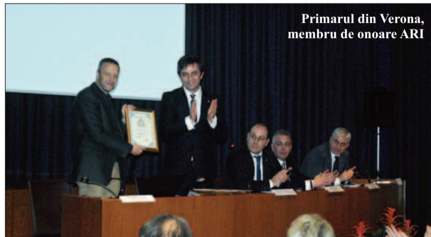
Primarul din Verona, membru de onoare ARI