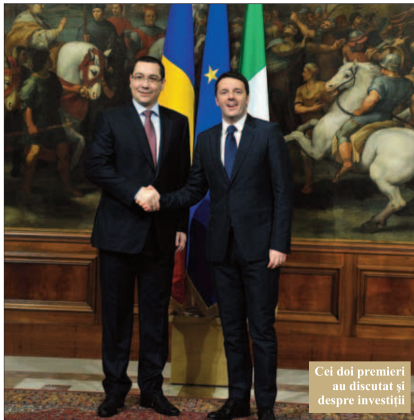
Cei doi premieri au discutat și despre investiții

Cred că investițiile vor continua să vină atâta timp cât România va oferi un mediu politic și economic stabil. Nu sa-