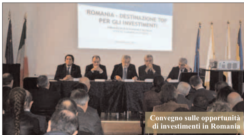
Convegno sulle opportunità di investimenti in Romania