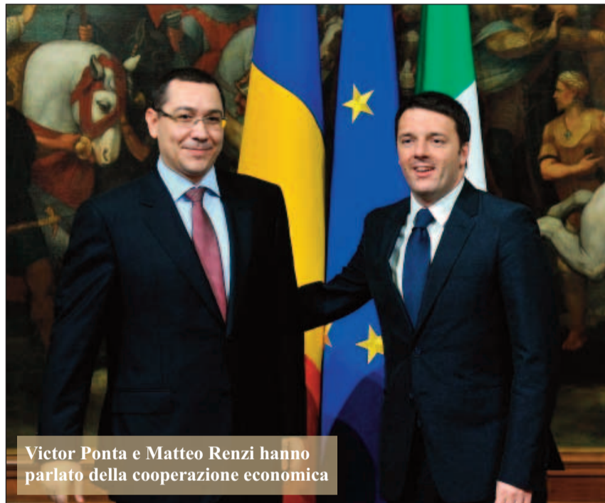
Victor Ponta e Matteo Renzi hanno parlato della cooperazione economica

Per quello che riguarda gli stipendi, si osserva che stanno cominciando ad aumentare, anche al seguito della sempre migliore formazione della manodopera.