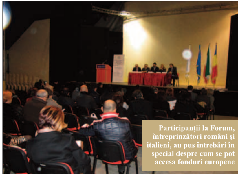
Participanții la Forum, întreprinzători români și italieni, au pus întrebări în special despre cum se pot accesa fonduri europene

Care sunt cele mai bune oportunități pentru investiții în România pentru italieni?