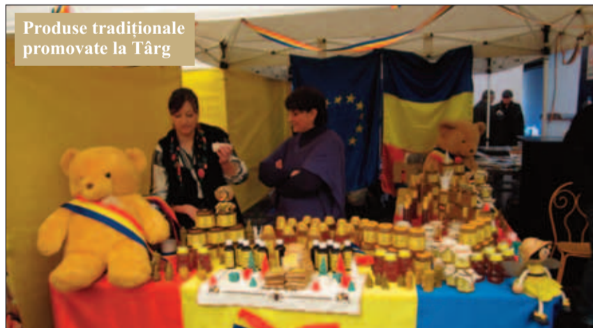
Produse tradiționale promovate la Târg