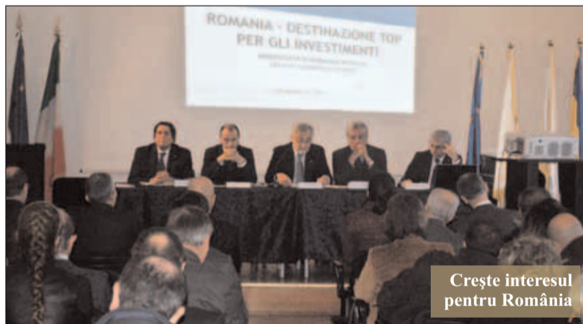
Crește interesul pentru România

În 29 noiembrie, la Accademia di Romania, în 30 noiembrie la Teatrul Tedastrice