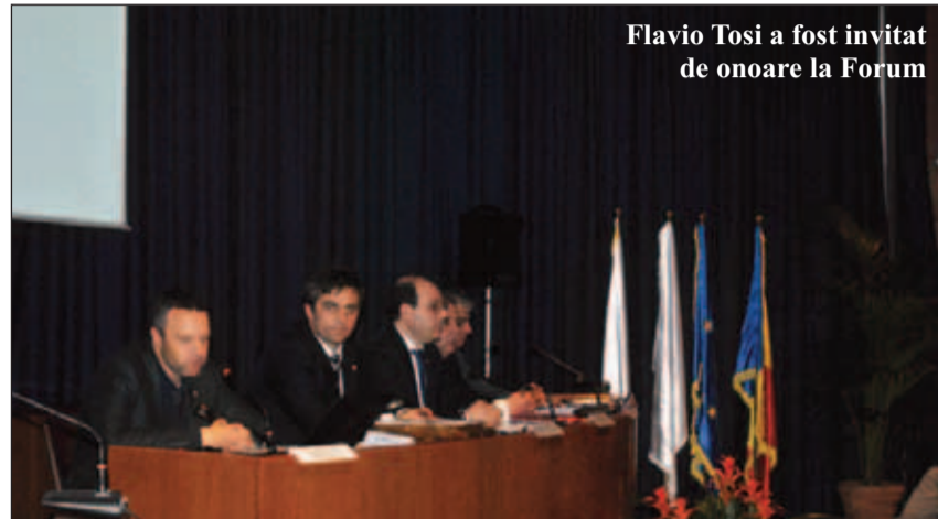
Flavio Tosi a fost invitat de onoare la Forum

Tva este mare, 24%, dar restul impozitelor au rămas la cota de 16%. România este a doua din acest punct de vedere, după Bulgaria. În privința atractivității pentru investiții străine, România este pe locul 7 din cele 28 de țări ale UE, potrivit unui studiu euro-