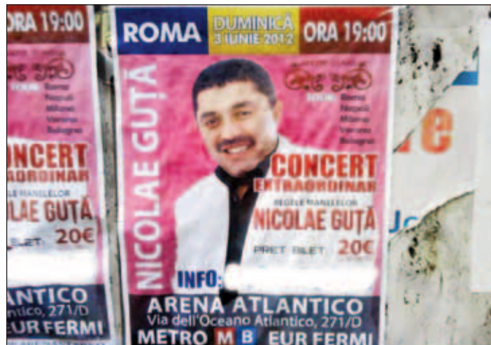
Poliția Municipală din Roma îi caută pe cei care au lipit afișele