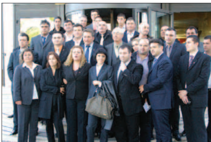
PDL Italia, pe vremea când încă era o organizație unită