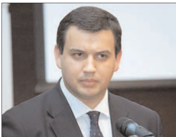
Eugen Tomac dictează condițiile sprijinirii diasporei