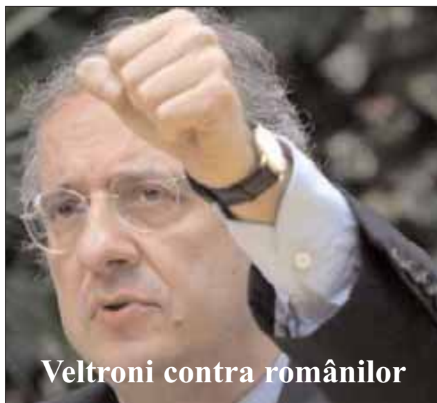
Veltroni contra românilor

"Din ianuarie până în august, din 3.557 de arestări făcute de carabinieri, 2.689 sunt români, echivalentul a 75,5%". Ce a uitat Veltroni, e clar că intenționat, este faptul că 3.557 de arestări se referă la străini.