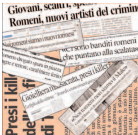
Imaginea românilor, creată de presă