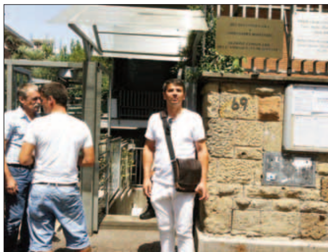
Votanții au fost primiți cu covor roșu la consulat

Am sunat la biroul de presă al Ambasadei, care ne-a acordat tot concursul, dar ni s-a spus că nu este de competența acestui birou să centralizeze și să furnizeze aceste date. Am sunat și la numărul verde introdus de MAE între 27 și 30 iulie pentru “informații utile cetățenilor români din afara granițelor, legate de Referendumul Național pentru demiterea Președintelui României din 29 iulie 2012”. (continuă la pag. 2)