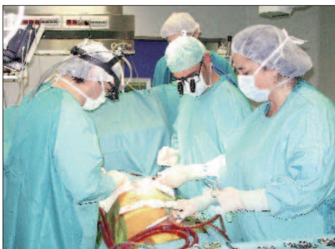
Operație complicată din punct de vedere medical și birocratic