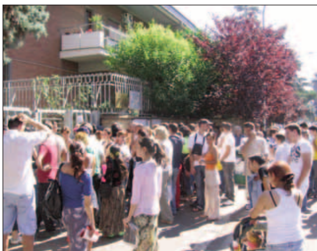
Consulatul nu mai înscrie certificate de naștere