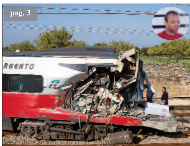
Tirul a fost lovit de un tren Eurostar de mare viteză

Trecere neregulamentară peste calea ferată, un șofer român inconștient a produs o tragedie