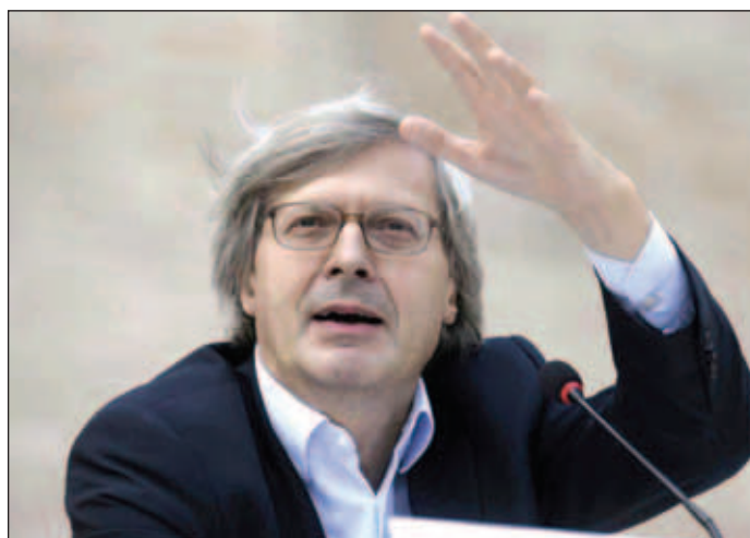
Primul interviu acordat de Sgarbi unui ziar românesc