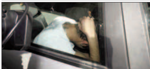
Doi dintre cei patru români arestați