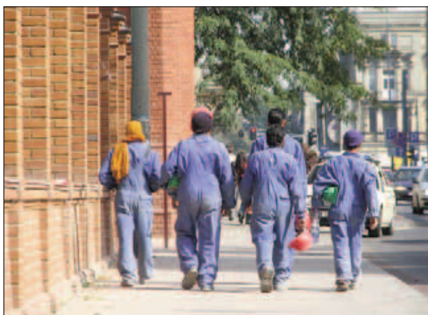
Sătui de muncă prin străini, mulți ar pleca mâine acasă