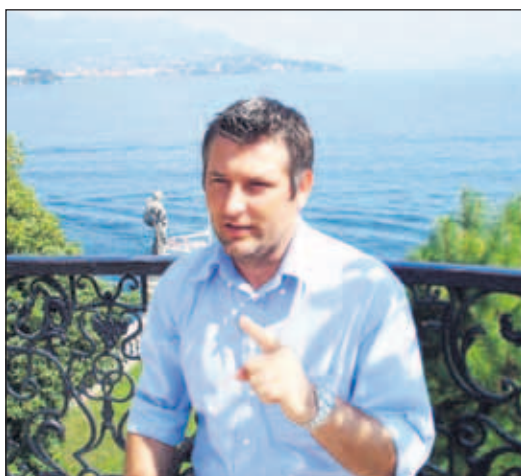
În 2009 a fost ales consilier cu 119 voturi

De ce, omule, nu ești mulțumit? Poate că Italia nu este țara în care curge lapte și miere, poate nu te apreciază la justa ta valoare... Dar acasă? Vei fi apreciat mai mult? Vei fi plătit mai bine? Vei fi tratat mai bine? (continuă la pag. 8)